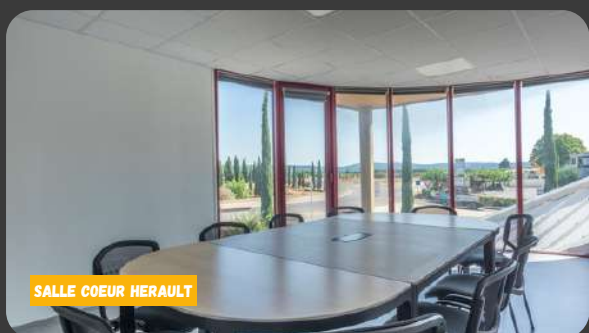
SALLE COEUR HERAULT

CAPACITÉ : 30 PERSONNES + FORMATEUR SALLE MODULABLE MATÉRIEL DE DÉGUSTATION (ATOUT TERROIR) : VERRES, NEZ DU VIN, CRACHOIRS TABLEAU ET RETRO PROJECTEUR